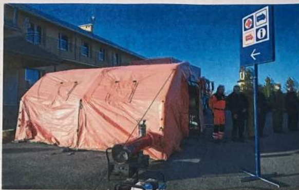
En algunas ciudades de Polonia ya se establecieron centros de recepción de refugiados donde se prestan servicios básicos.

Las imágenes de centenares de vehículos atascados en las arterias viales intentando salir de la ciudad de Kiev podrían ser solo el preludio de otra crisis que está por estallar: la de refugiados a causa de la ofensiva armada emprendida por el presidente ruso, Vladimir Putin.